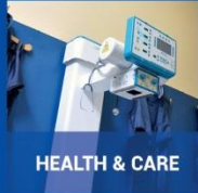
HEALTH &amp; CARE